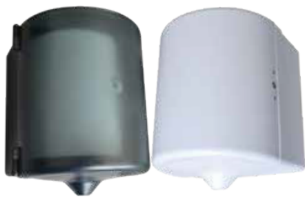
Color Código Gris DIS0162 Blanco DIS0163

Toalla de manos Center Pull Biosolutions 2h, 100 m