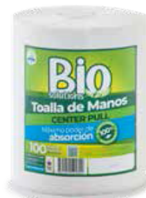
Presentación Códigos x1 ABS0263 x4 ABS0076

Toalla de manos Center Pull Biosolutions 2h, 100 m